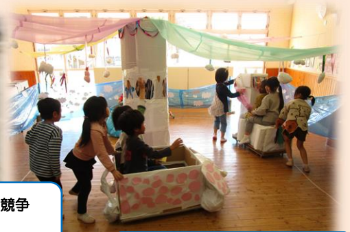
さかいがわラクテンチ