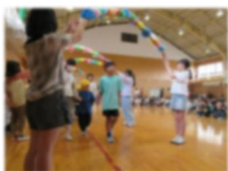
～幼稚園と1年生を迎える会～

幼稚園と小学校が同じ敷地内にあるので、亀川小学校のお兄さん・お姉さんと自然な形で交流ができています。教職員同士も子どもの様子を伝え合い、幼小の子どもたちが共に育つよう連携を図っています。特に 1年生と5年生との交流を多くもち、幼稚園から小学校へと滑らかな接続をめざして交流・連携を進めています。