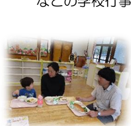
*給食参観日(試食会)*