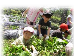
*1年生とジャガイモ掘り*