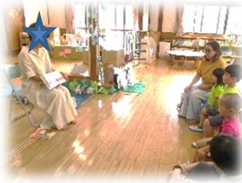
*東山ブックリーディング*