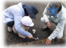
*シイタケのコマ打ち*