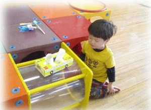
*ゲームボックス遊び*